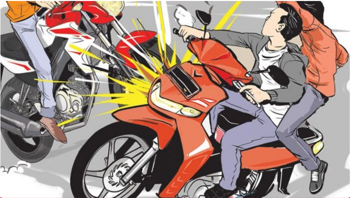
Ilustrasi laka lintas

BANYUWANGI - Dua unit sepeda motor mengalami kecelakaan lalu lintas adu banteng di Jalan Raya Jember, Desa Tulungrejo, Kecamatan Glenmore, Kabupaten Banyuwangi, Jawa Timur. Lakalantas yang melibatkan sepeda motor Honda CBR 150 R nopol P 5657 ZR kontra Honda Scoopy nopol P 6619 RB. Akibat kecelakaan tersebut, satu orang meninggal dunia sedangkan tiga lainnya mengalami luka-luka, Sabtu (30/3/2024).